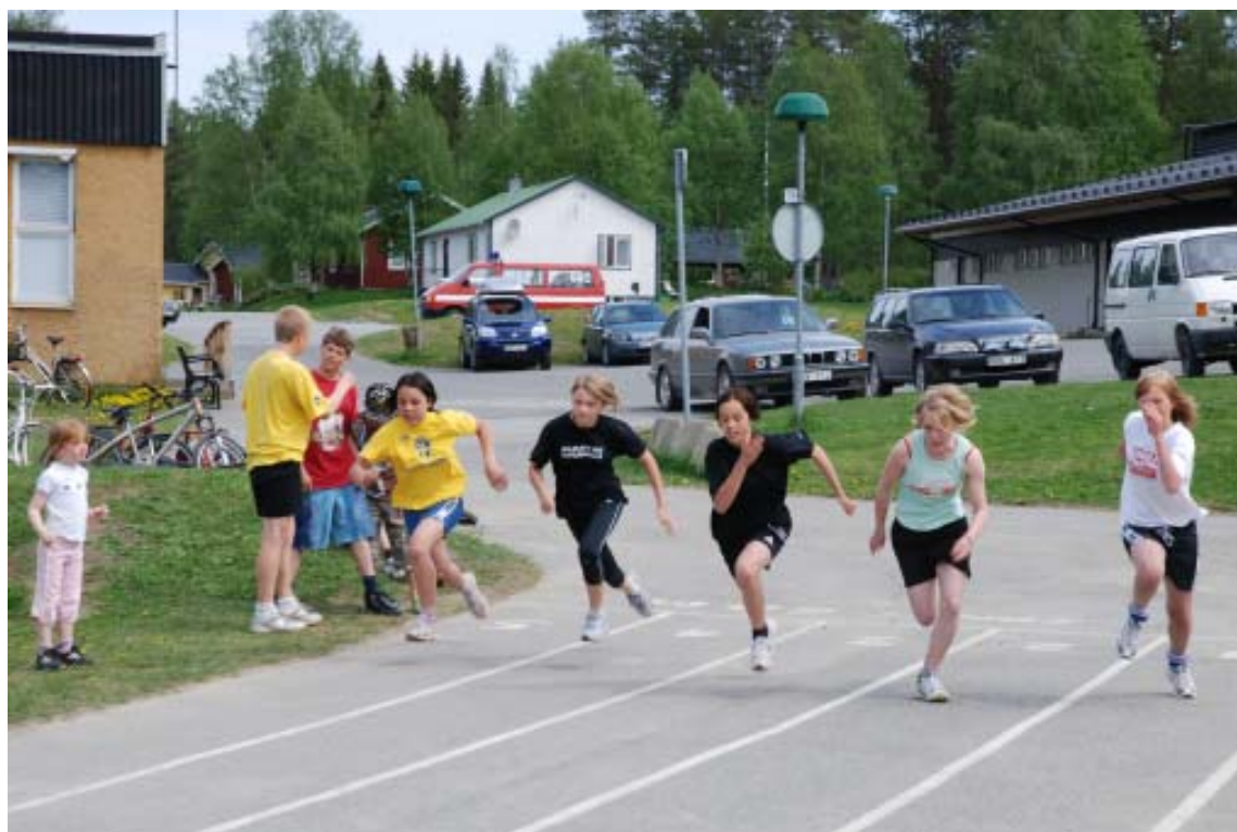
Fartfylld bild från Vildmannaspelen i Storuman.