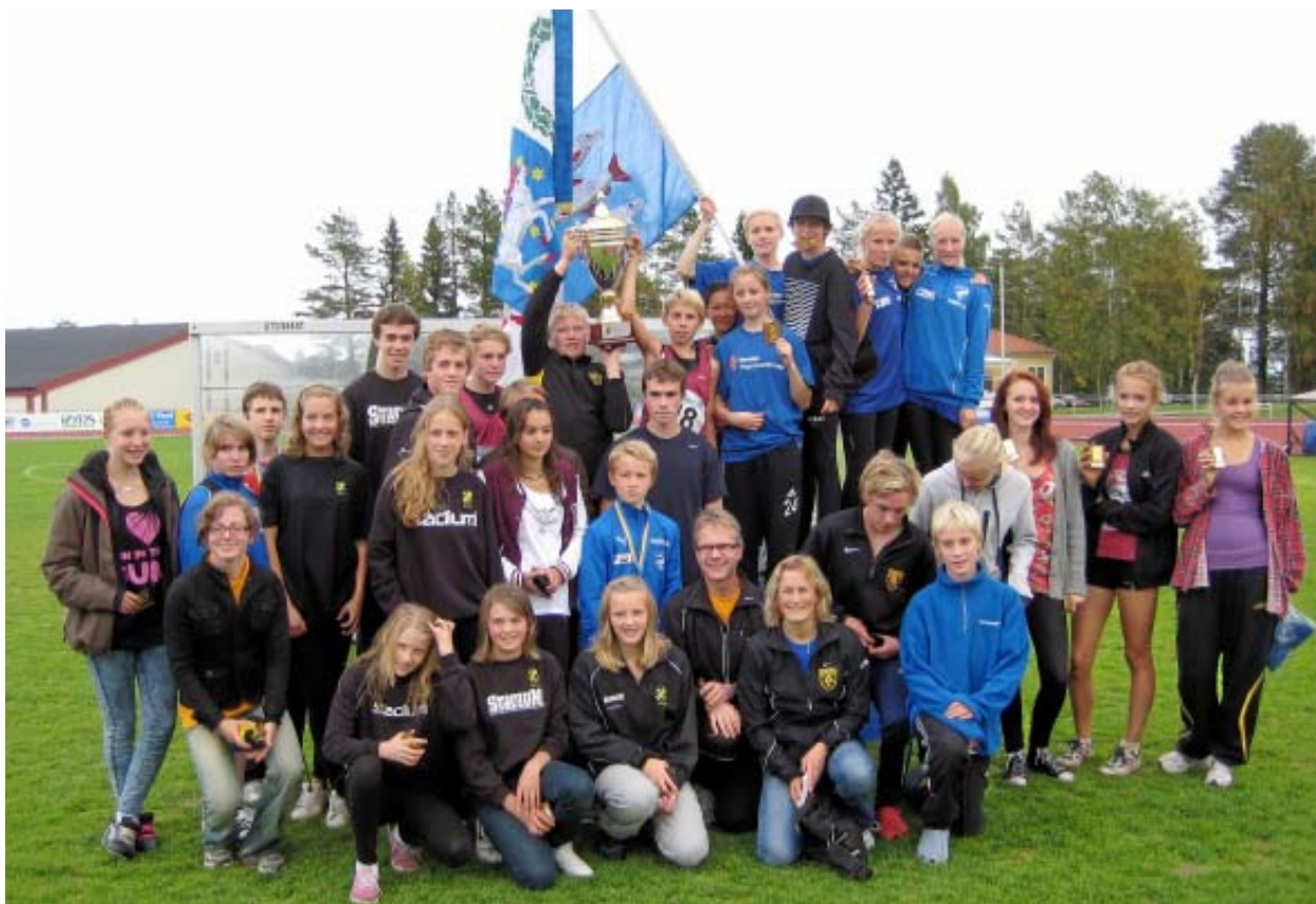
Västerbottens segrande lag vid Nordea Regionsmästerskap i Sundsvall den 11-12 september.

Idrottens Hus, Järvedsleden 2, 891 60 Örnsköldsvik Pg 28 55 56-7, 0611-100 82 lthunman@hotmail.com http://iof2.idrottonline.se/templates/ Workroom.aspx?id=2291