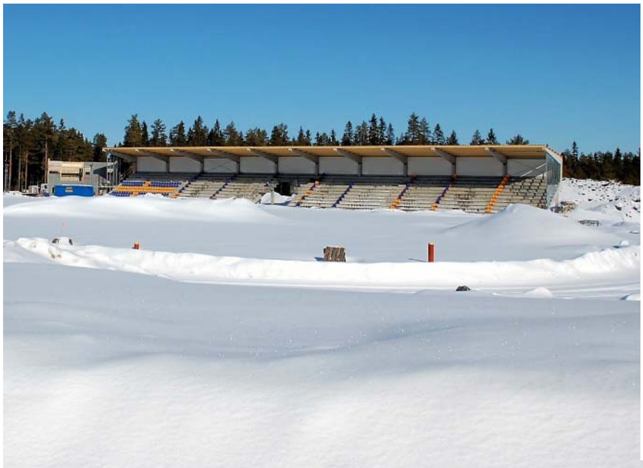
Byggandet av Campus Arena pågick mitt i smällkalla vintern.