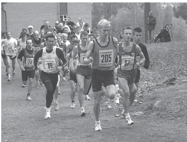
Starten vid Gamliaterrängen 22 maj 2006.