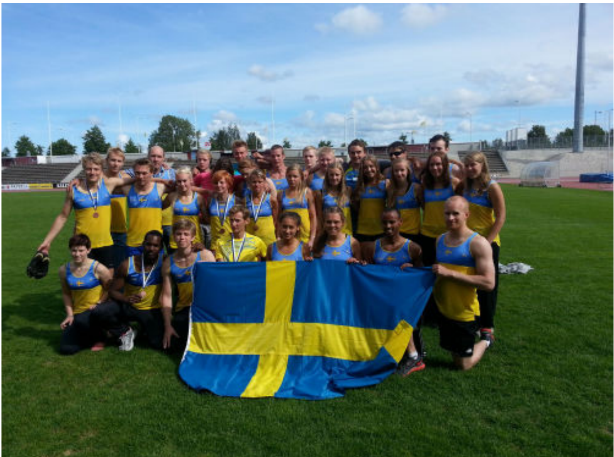
Det svenska herr- och damlaget vid Barentskampen i Uleåborg 21-22 juli 2012.