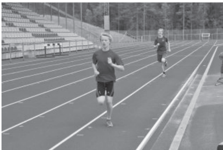
Tävlingar på Campusarenan i Umeå i juni 2012.